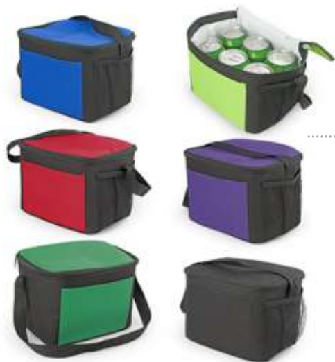
COOLER ..... BERNA