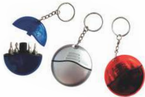
NOV H-23 .....