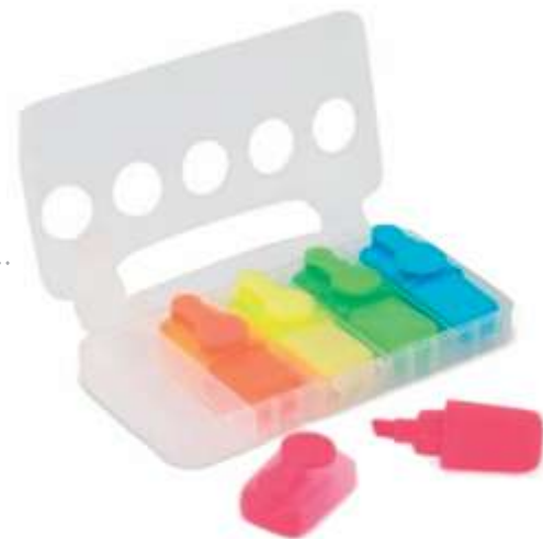
MALETÍN 5 COLORES .....