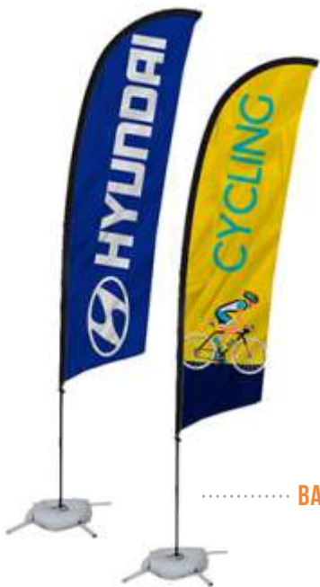
MARCOS PARA SELFIES