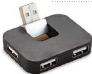
PUERTO USB ..... GLORIK