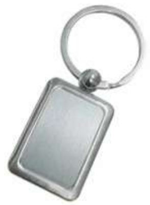
..... NOV L-74