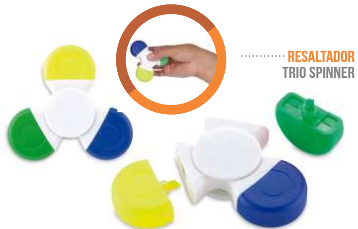
..... RESALTADOR TRIO SPINNER