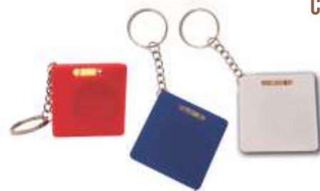
NOV P-24 .....