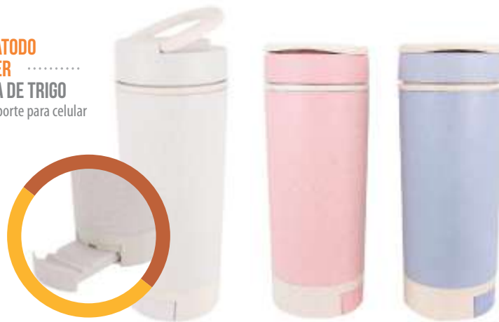
TOMATODO POWER ..... FIBRA DE TRIGO con soporte para celular