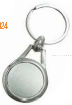
..... NOV L-76