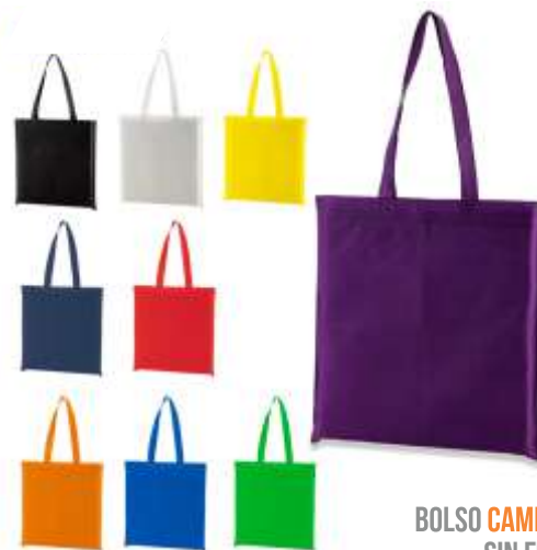
BOLSO CAMBRELL SIN FUELLE