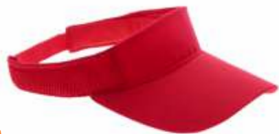
VISERA ..... GONNAX