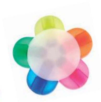
..... FLOR 5 COLORES