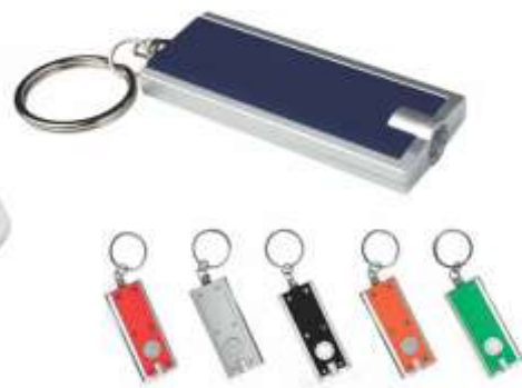
NOV P-36 .....