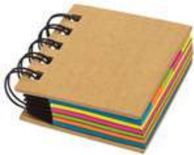
NOV E-774 .....