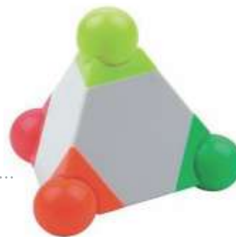
PIRÁMIDE 5 COLORES .....