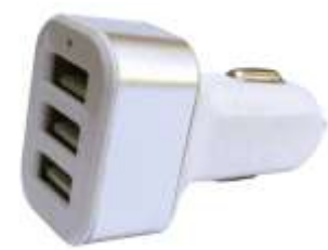
USB 3 PUERTOS PARA AUTO .....