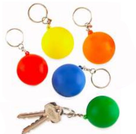
NOV P-35 .....