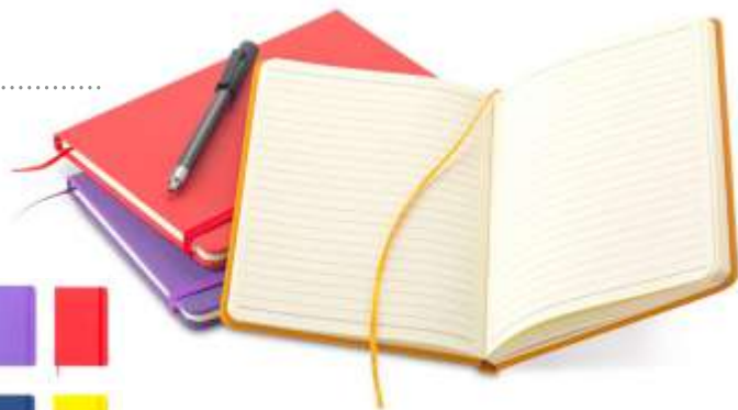
NOTEBOOK VARIEDAD DE COLORES