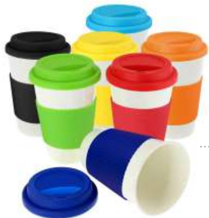
..... NOV 300 CERÁMICA