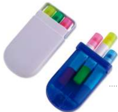
..... ESTUCHE PARA RESALTADOR MÁGICO