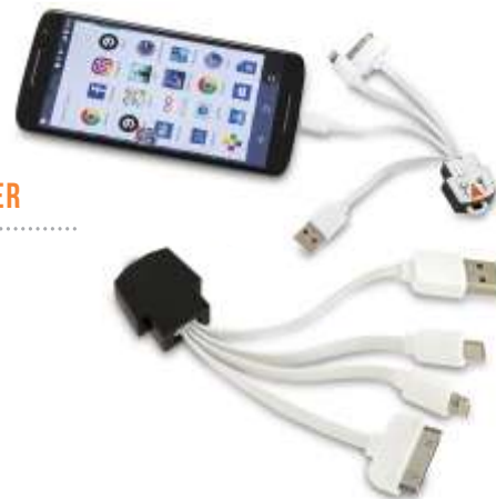
DATA TRANSFER CABLE .....