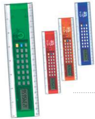
..... REGLA NOV 363