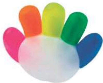
..... MANITO 5 COLORES