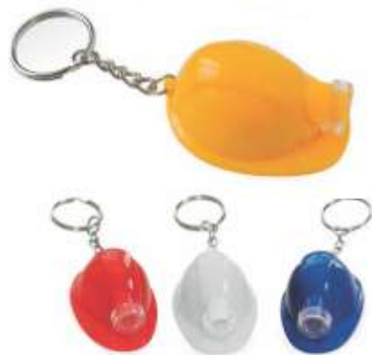
NOV P-34 .....