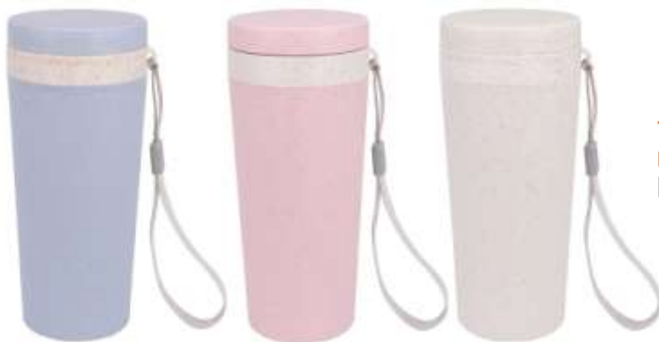
TOMATODO CLASSIC ..... FIBRA DE TRIGO