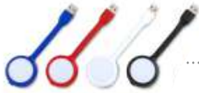
MULTIPUERTO LUZ LED