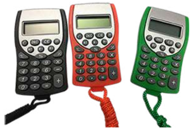
CALCULADORA NOV 367 .....