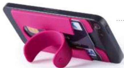
PORTA TARJETERO CELULAR ..... MOD. REX