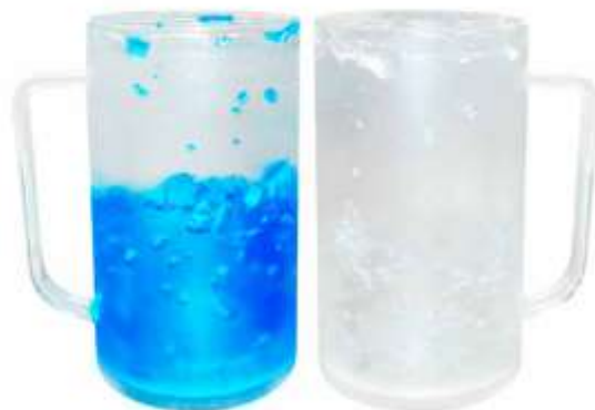
..... NOV T-86