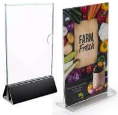
..... TABLE TENTS