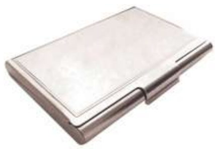
..... NOV T-204