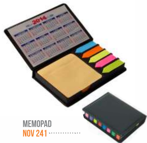
MEMOPAD NOV 241 .....