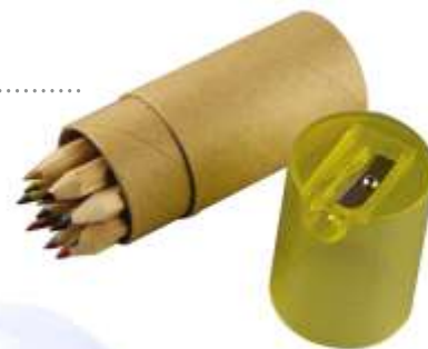
SET DE COLORES ECOLÓGICO