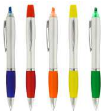
..... LAPICERO CON RESALTADOR