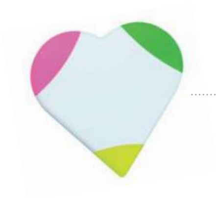
..... CORAZÓN 3 COLORES