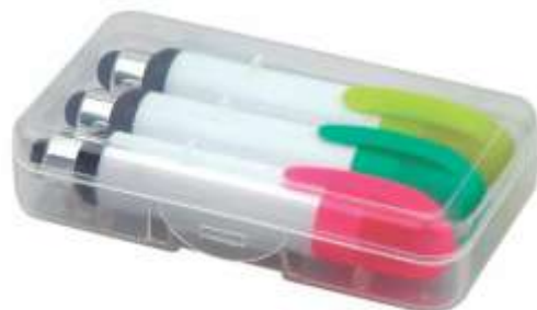
NOV RE-006 TOUCH .....