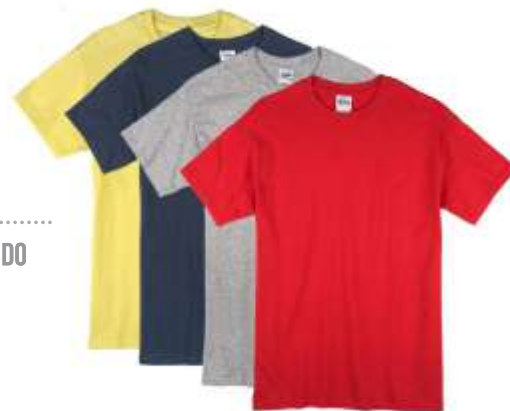
POLOS ..... CUELLO REDONDO