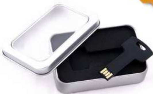
USB LLAVE ..... CON CAJA DE METAL