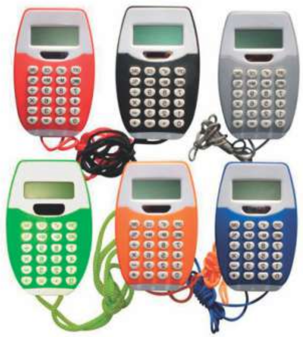
CALCULADORA NOV 366 .....