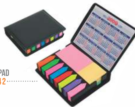
MEMOPAD NOV 242 .....