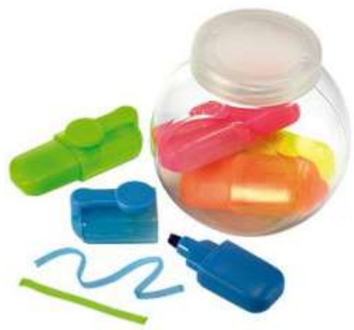
..... BOL DE RESALTADORES