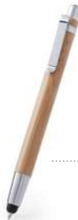
..... BAMBOO C12 TOUCH