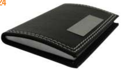
..... NOV T-206