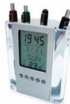
PORTALAPICERO NOV 270 .....