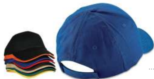
..... GORRA DE DRILL