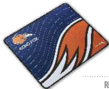
PAD MOUSE RECTANGULAR O CON FORMA