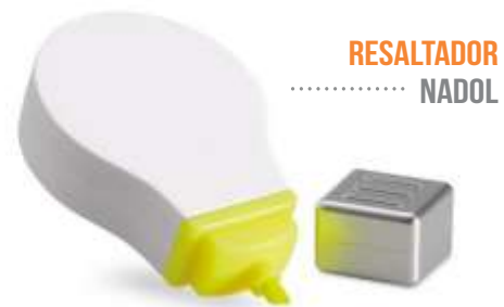
RESALTADOR ..... NADOL