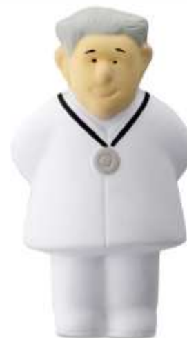
ANTISTRESS DOCTOR .....