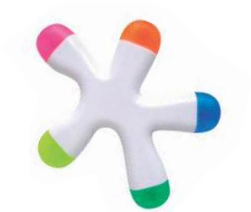
MANCHA 5 COLORES .....