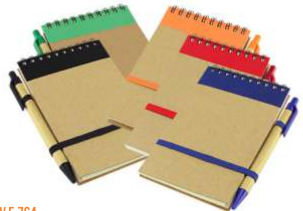
NOV E-764 .....