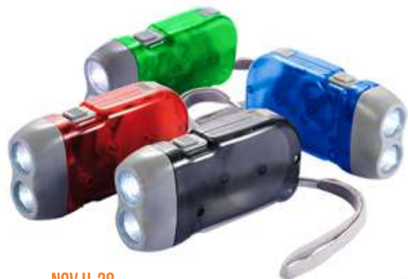
NOV H-28 .....