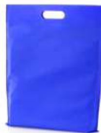
BOLSA BLASTER CON ASA TROQUELADA