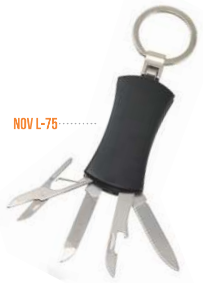
NOV L-75 .....