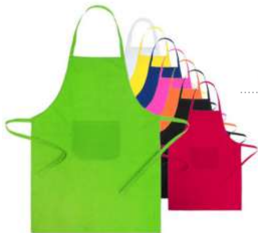
DELANTAL ..... XIGOR