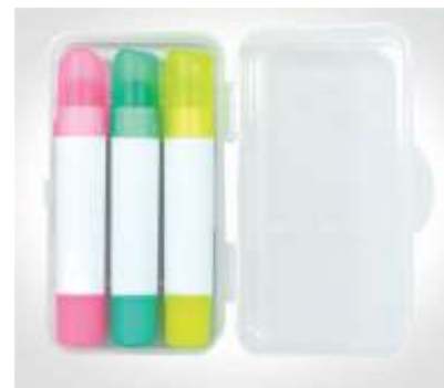
NOV RE 005 .....