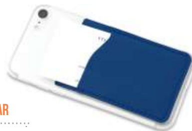
PORTA TARJETA CELULAR NO INCLUYE CELULAR .....