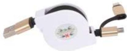
CARGADOR CABLE RETRÁCTIL .....