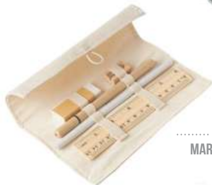
..... KIT MARIAN