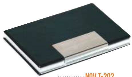
..... NOV T-202