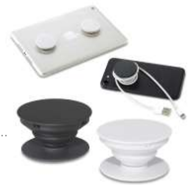
POP SOCKET .....