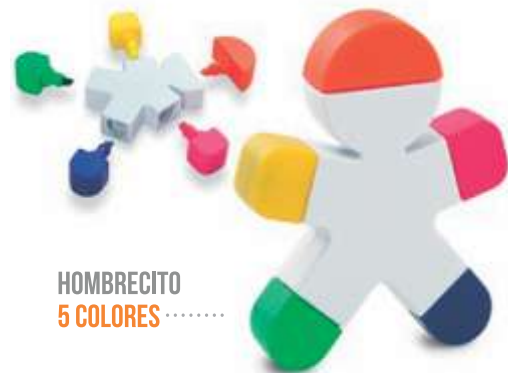
HOMBRECITO 5 COLORES .....