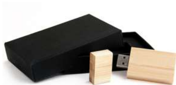
USB BAMBOO .....