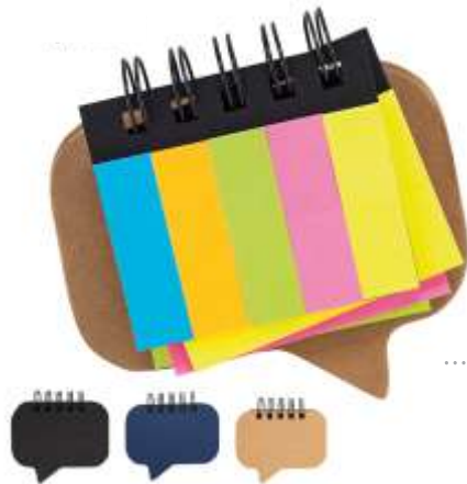
..... NOV E-882