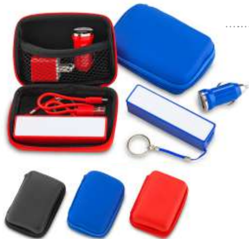
SET DE VIAJE ..... CON PILA RECARGABLE