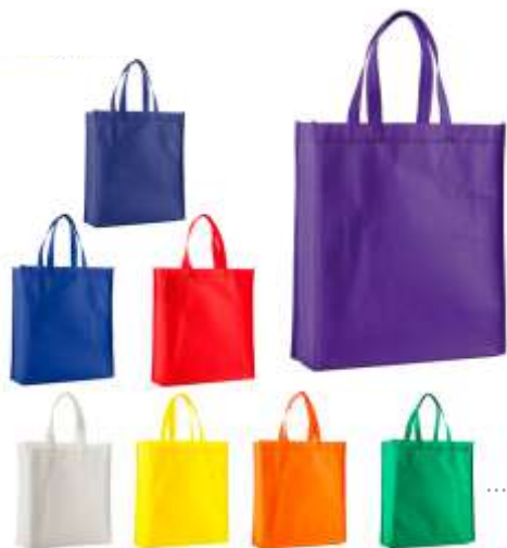
BOLSO CAMBRELL CON FUELLE