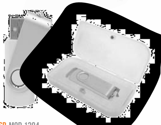
USB MOD. 1304 .....