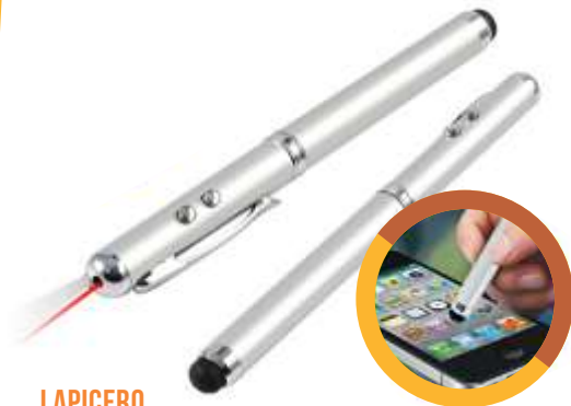
LAPICERO 4 EN 1 .....