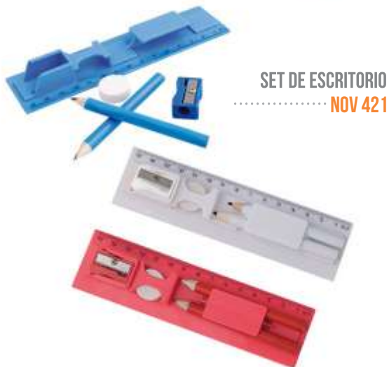
SET DE ESCRITORIO NOV 421 .....