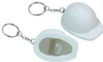
NOV P-29 .....