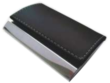
NOV T-200 .....