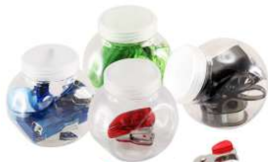
SET DE ESCRITORIO NOV 232