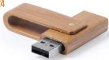
USB MADERA .....