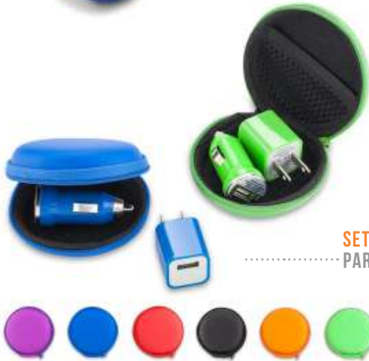
SET CARGADOR PARA CELULAR