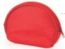
..... MONEDERO MEDIALUNA