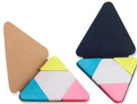
..... NOV E-849