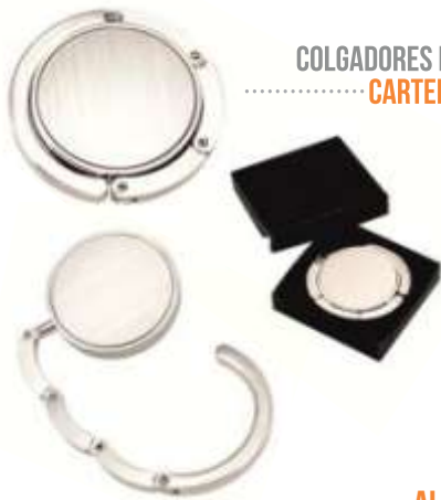
COLGADORES DE CARTERA