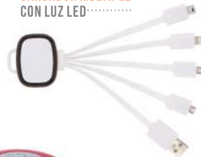
CARGADOR MÚLTIPLE CON LUZ LED .....