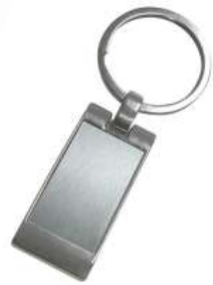
..... NOV L-73