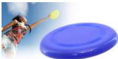
..... FRISBEE GIROX