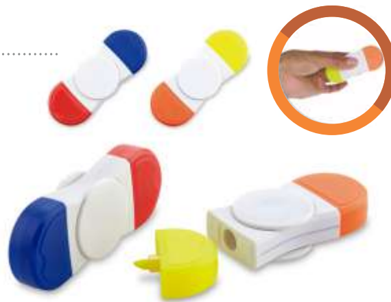
RESALTADOR ..... DUO SPINNER