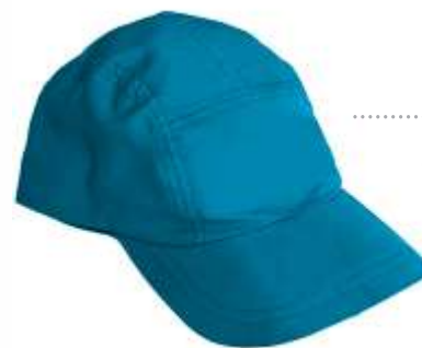
..... GORRA 4 TAPAS