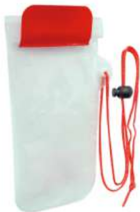
FUNDA IMPERMEABLE PARA CELULAR .....