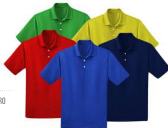
POLOS ..... CUELLO CAMISERO