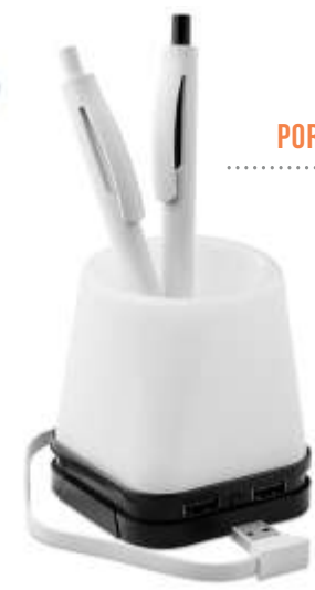
PORTALAPICEROS ..... CON USB