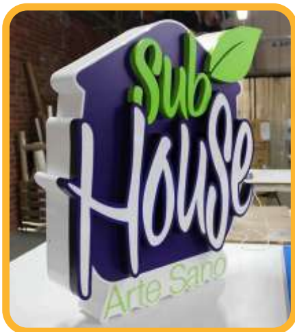
LETEREROS LUMINOSOS .....