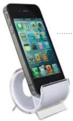
PORTACELULAR ..... MOD. KING