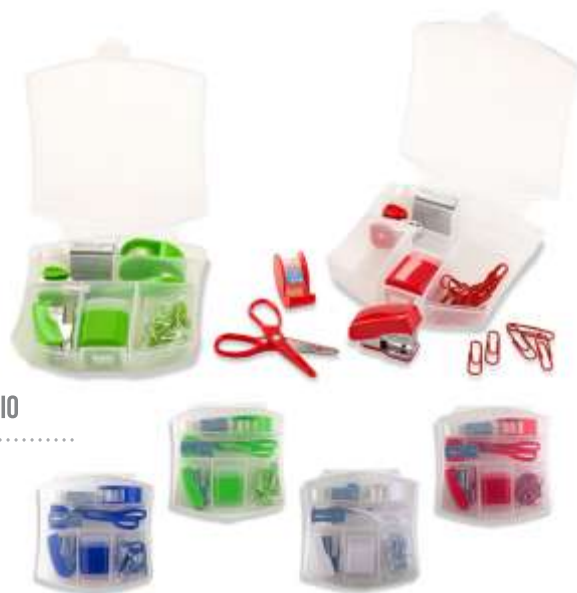
SET DE ESCRITORIO NOV 233 .....