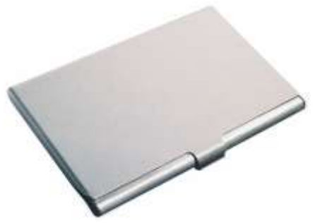
..... NOV T-205