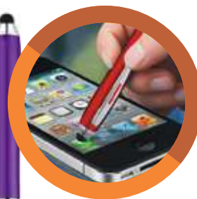
LAPICERO ..... TOUCH