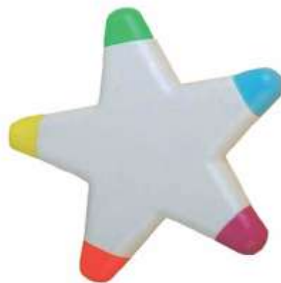
..... ESTRELLA 5 COLORES