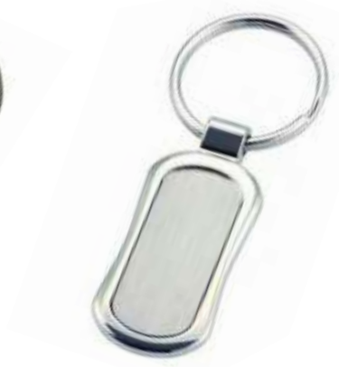
NOV L-70 .....