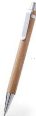
..... BAMBOO C15