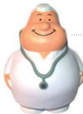
ANTISTRESS DOCTOR GORDITO .....