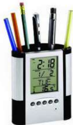
PORTALAPICERO NOV 271 .....