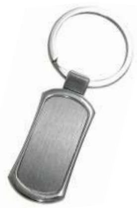
NOV L-72 .....