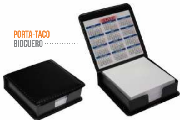
PORTA-TACO BIOCUERO .....