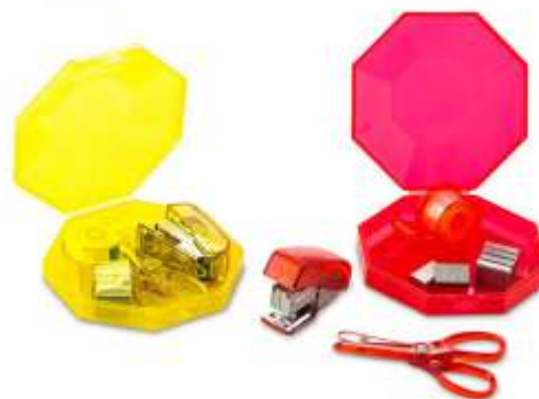
SET DE ESCRITORIO OCTAGON