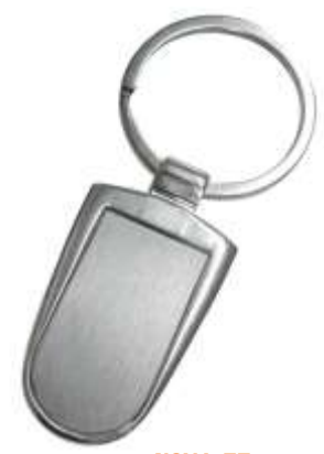
..... NOV L-77