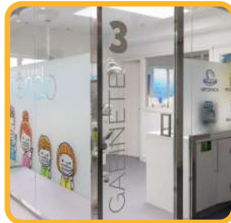
VINILES DECORATIVOS .....