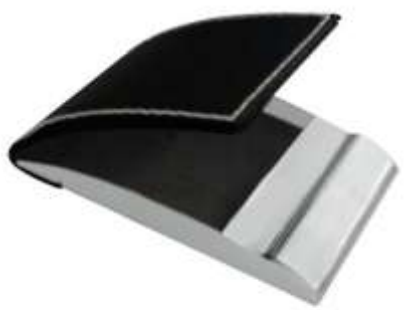
NOV T-203 .....