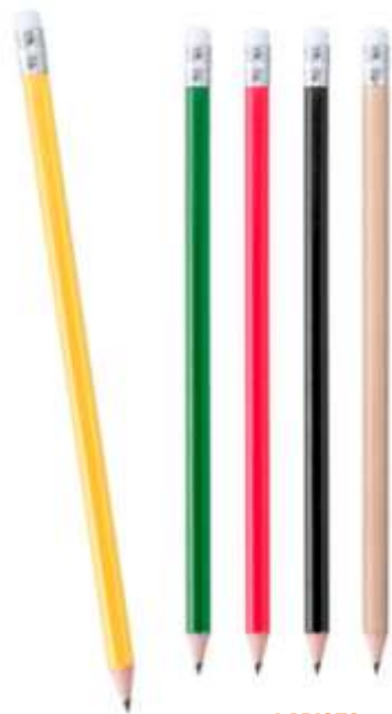
..... LAPICES DE COLORES