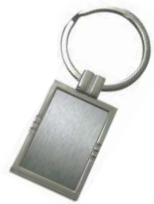
NOV L-71 .....