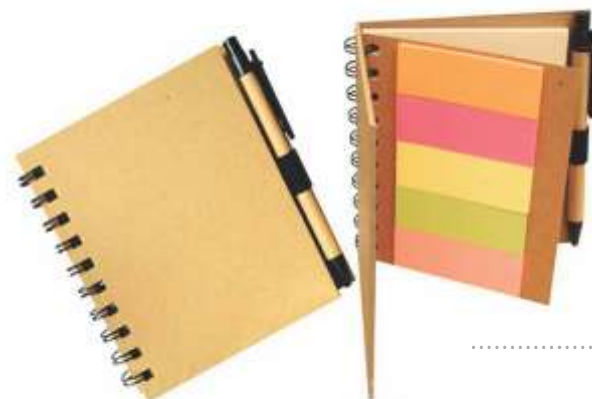
..... NOV E-785