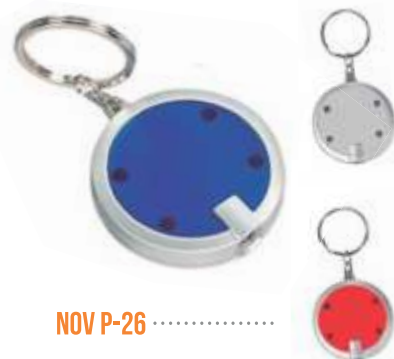
NOV P-26 .....