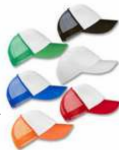
GORRAS ..... CON MALLA