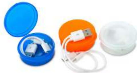
AUDÍFONOS MARVI .....