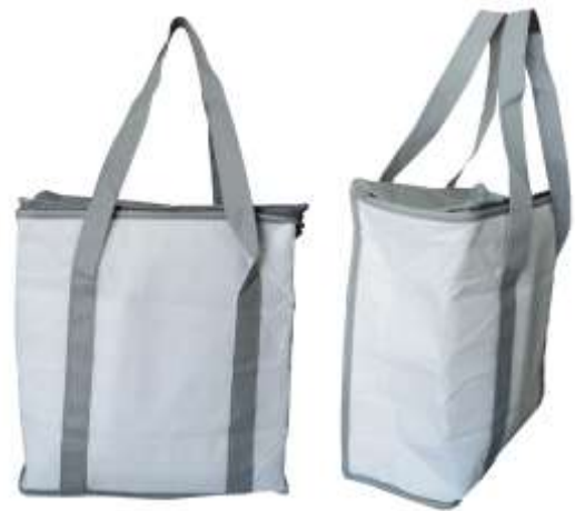
MOCHILAS COLAPSIBLES DIFERENTES COLORES .....